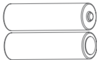
2x AA batteries

Vegyük ki az elemeket és tegyük bele az újakat.